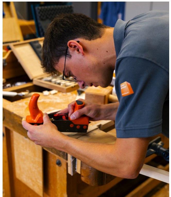
Der Zweitplatzierte bei der Arbeit