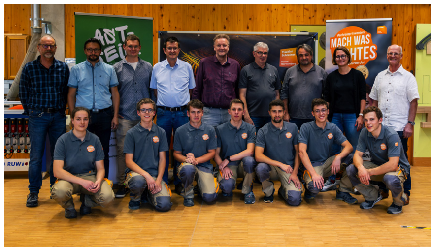
Vertreter der Schule, Innung, LVF und die Teilnehmenden auf einen Blick!

Zur Verkündung des Endergebnisses wurde die Werkstatt wieder auf Vordermann gebracht, die Arbeitsplätze auf-