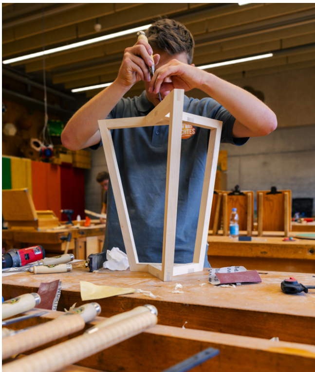
Der konzentrierte Sieger